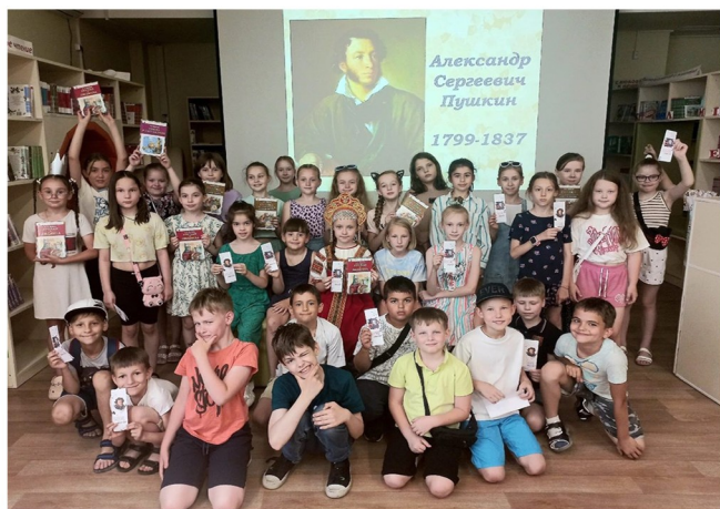
Праздник в детской библиотеке

6 июня исполняется 225 лет со дня рождения великого русского поэта А.С. Пушкина. К знаменательному юбилею в детской библиотеке МАОУ СОШ №104 для ребят 2 классов прошел библиотечный урок «Там, на неведомых дорожках».