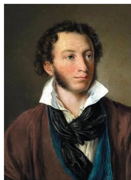
ПУШКИН АЛЕКСАНДР СЕРГЕЕВИЧ 1799 - 1837

Учебный год закончился, а значит, время выставлять итоговые оценки. Если вы учились не на одни пятерки, не расстраивайтесь — даже самые великие получали в школе тройки и двойки.