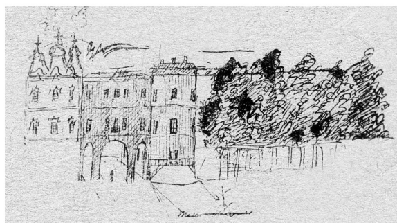
Иллюстрация Царскосельского лицея

Лицеисту А.С. Пушкину тяжело давались предметы, которые не вызывали интереса. Поэтому по таким предметам, как математика, логика, немецкий язык, будущий великий поэт, говоря современным языком, был троечником.