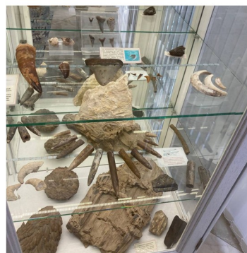
Разнообразие горных пород