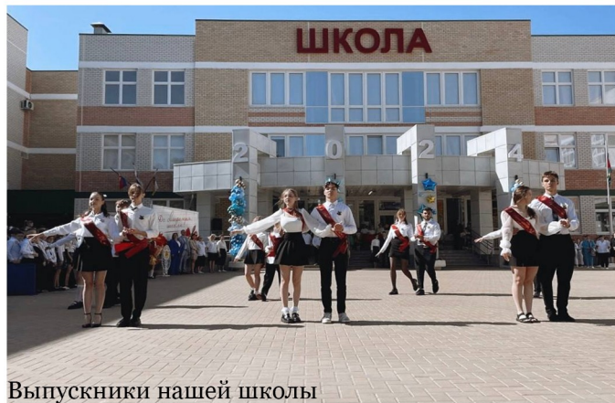
Выпускники нашей школы