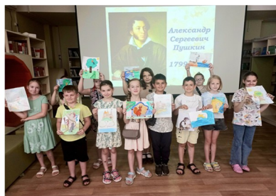
Порисовали любимых героев

Ребята окунулись в чудесный мир любимых сказок: принимали активное участие в сценках по известным сказкам, собирали пазлы по фрагментам из сказок, отвечали на вопросы викторины «Знаешь ли ты сказки Пушкина?», а также ребята принесли рисунки по своим любимым произведениям А.С. Пушкина, которые сделали дома.