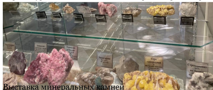
Выставка минеральных камней