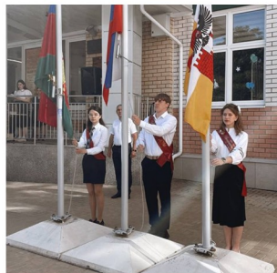
Церемония поднятия флагов

25 мая прошла торжественная линейка «Последний звонок». Грусть и радость долгожданного события одновременно охватывали толпы учеников – выпускников нашей школы. На глаза наверчивались слезы. Кажалось, еще недавно