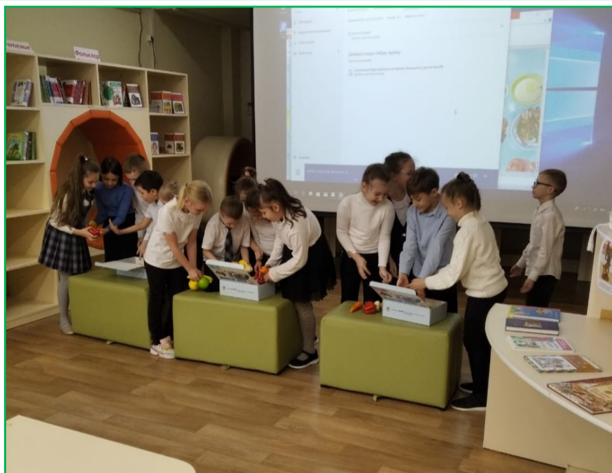
Интерактивная игра, направленная на изучение профессии

Руководитель центра профориентационной работы СОШ №104.