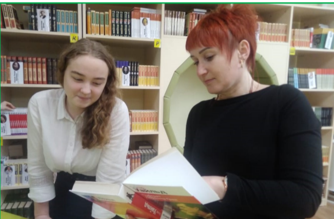
Проведение акции в библиотеке