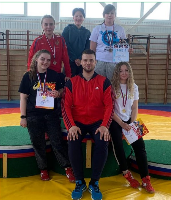
Денис Александрович с воспитанницами