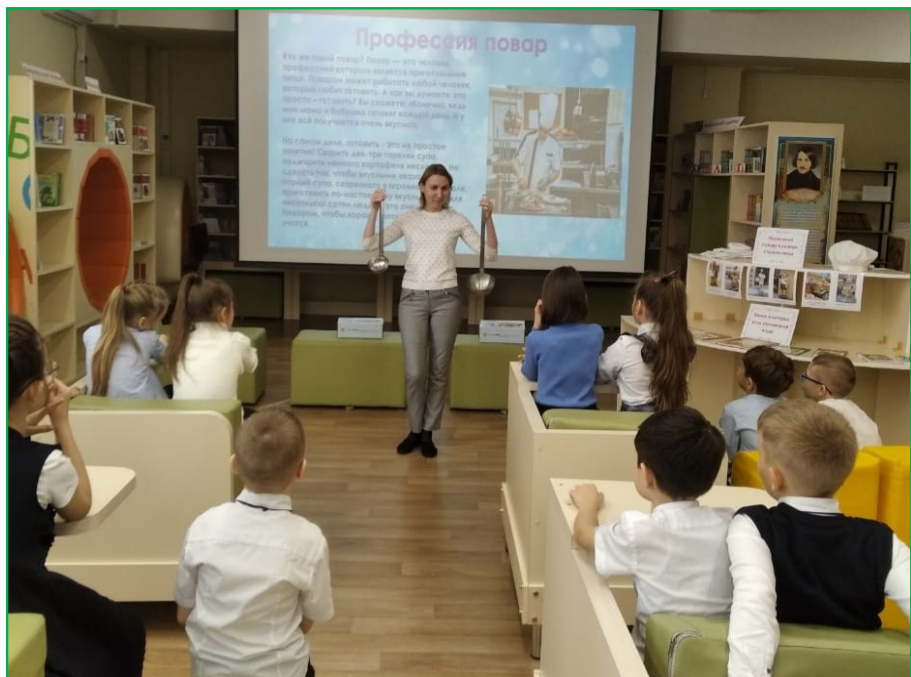
Знакомство с профессией «повар»