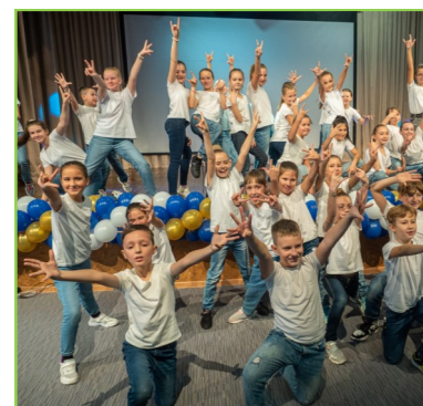
Творческий коллектив «Данс-Гала» стал обладателем ГРАН-ПРИ XI открытого фестиваля-конкурса «Надежда, возрождение Кубани».