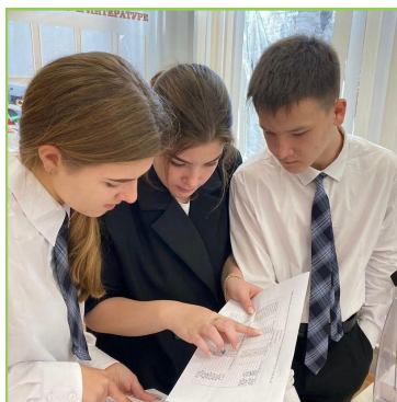
Внеурочная деятельность учеников ведется по нескольким направлениям: школьное ученическое самоуправление, волонтерство, РДШ.