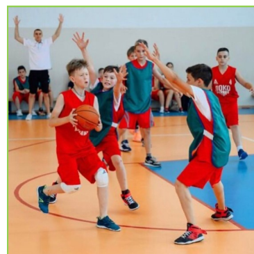
Наша школа стала площадкой для проведения городских соревнований проекта ЛОКОСТАРТ.