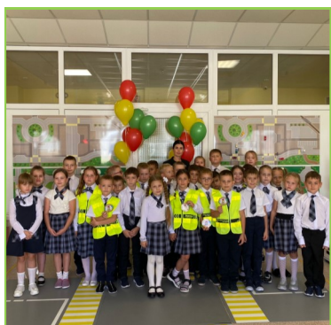
Торжественно открылся класс ПДД, где наглядно и доступно проводятся занятия по безопасному поведению на дорогах.