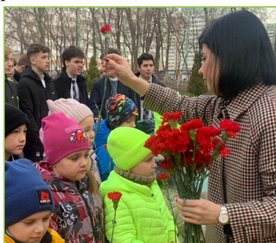
Подготовка к торжественному возложению