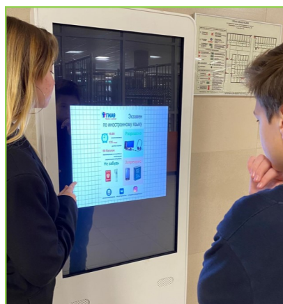
Информационный киоск, 1 этаж, блок А

Для удобства пользователей в электронном табло предусмотрена сенсорная система управления.