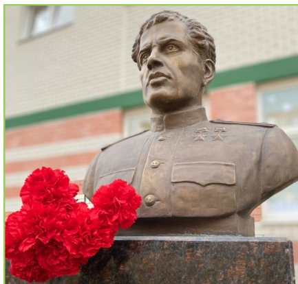
Бюст Виктора Николаевича Леонова

Самым любознательным жителям новостроек известно о выдающихся личностях, чей последний бой спас жизни мирных жителей и друзей-однополчан, предотвратил террористическую атаку и разгромил бандформирования. Это герои современной России, они - участники локальных войн и миротворческих операций. Не только наименования улиц напоминают нам об их подвигах.