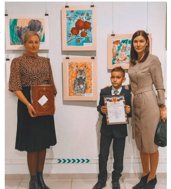
На выставке Краевого художественного музея