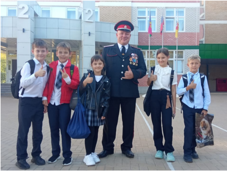
Встреча с ветераном

Однажды мы с ребятами вышли из школы и увидели сидящего на лавочке мужчину в военной форме с медалями. Мы очень удивились, что у него на груди много медалей и сразу подумали, что он, наверно, Герой. Мы с друзьями очень хотели подойти к нему, но стеснялись.