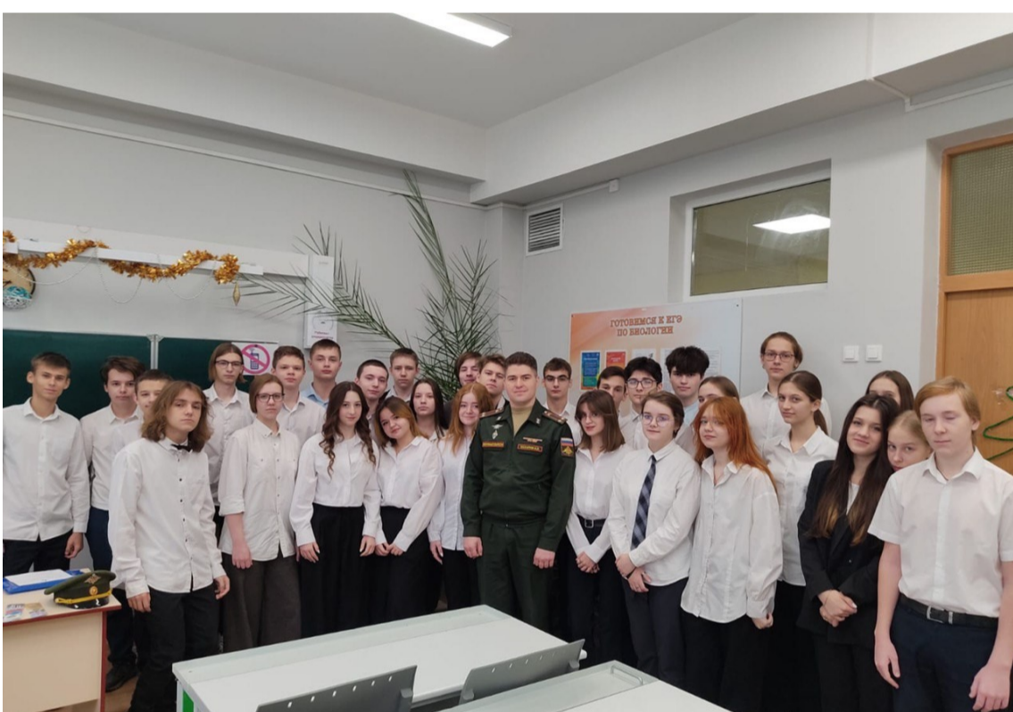
По традиции - фото на память