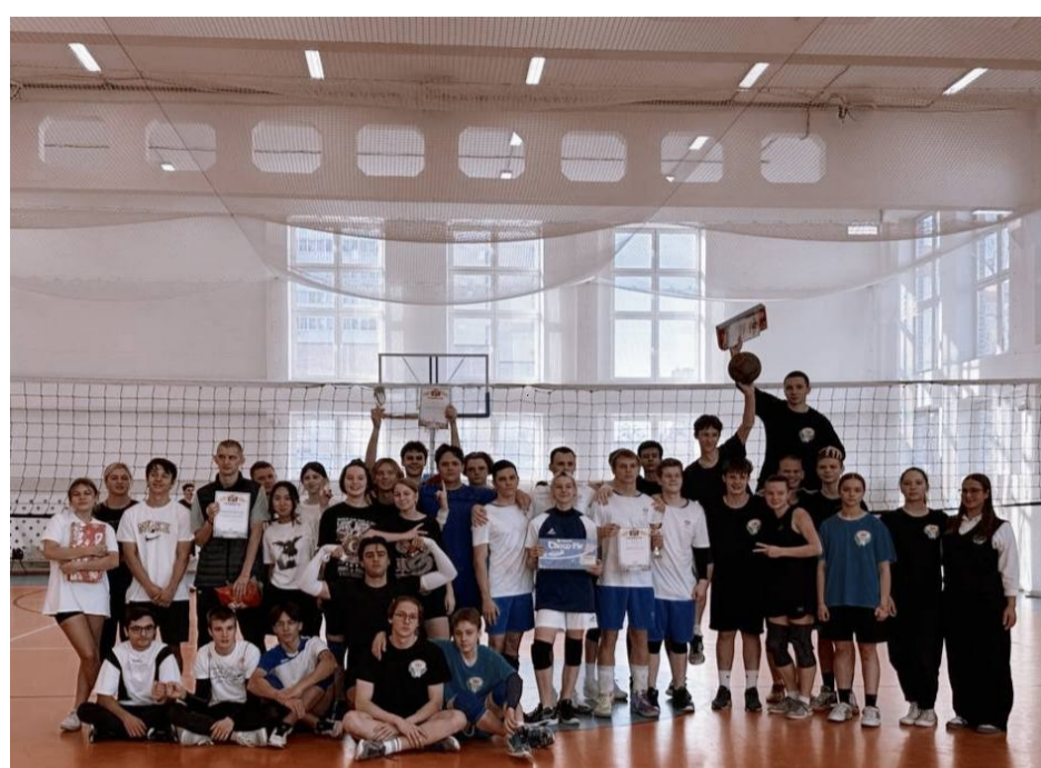
Сборная команда по волейболу MAOU СОШ №104