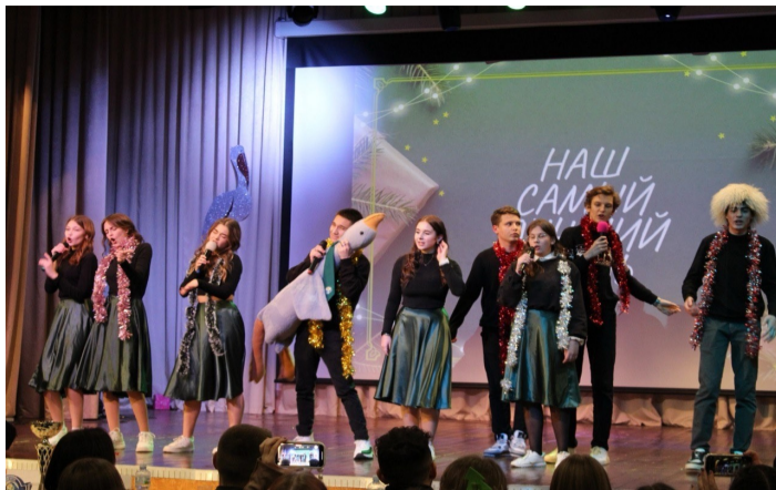
«Ёлки 11» искромётно шутят

Команды сыграли четыре конкурса: приветствие, разминка, видеоконкурс и музыкальный фристайл. Шутки были настолько зажигательными, что в зале не смолкал смех, а аплодисменты зрителей не прекращались во время всей игры.