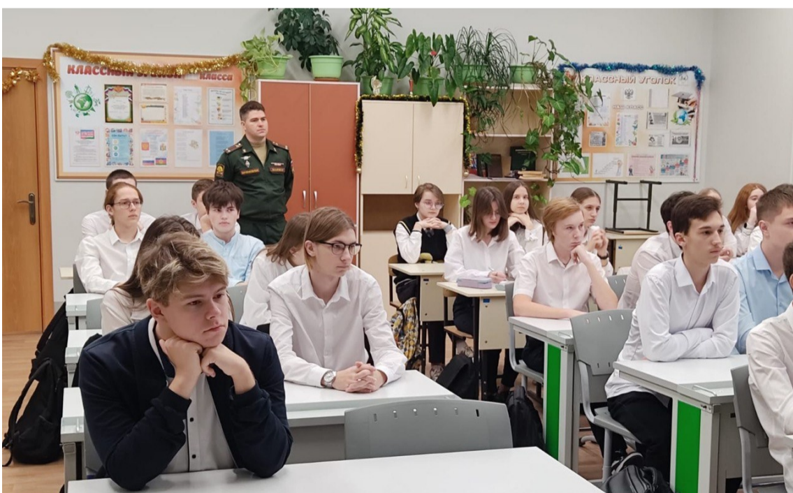
Ребята знакомятся с презентацией о военных специальностях

Выпуск подготовили: Редактор Русакова С.В.