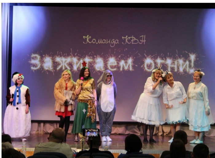
«Мы зажигаем огни» - кредо учителей

Шутки не прекращались даже во время награждения