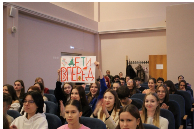
Мощная поддержка болельщиков