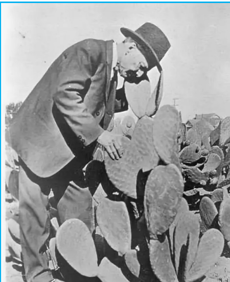
Лютер Бербанк разговаривает с кактусом

Представьте, как было бы здорово, если бы человек мог регенерировать свои ткани подобно ящерице, у которой отрастает оторванный хвост. Возможно ли это? Вполне – отвечают ученые.