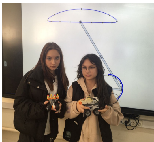
Работы своими руками

Если школы в Краснодаре строятся, то колледжи и высшие учебные учреждения нет. При растущем населении возрастает и конкуренция. На престижные специальности конкурс может достигать свыше 20 человек на место. Это говорит о том, что оценки в аттестате за 9 класс и баллы ЕГЭ играют важную роль, а значит, нужно учиться на отлично, чтобы успешно конкурировать с другими абитуриентами. Осознание серьезности положения – лучшая мотивация к учебе.