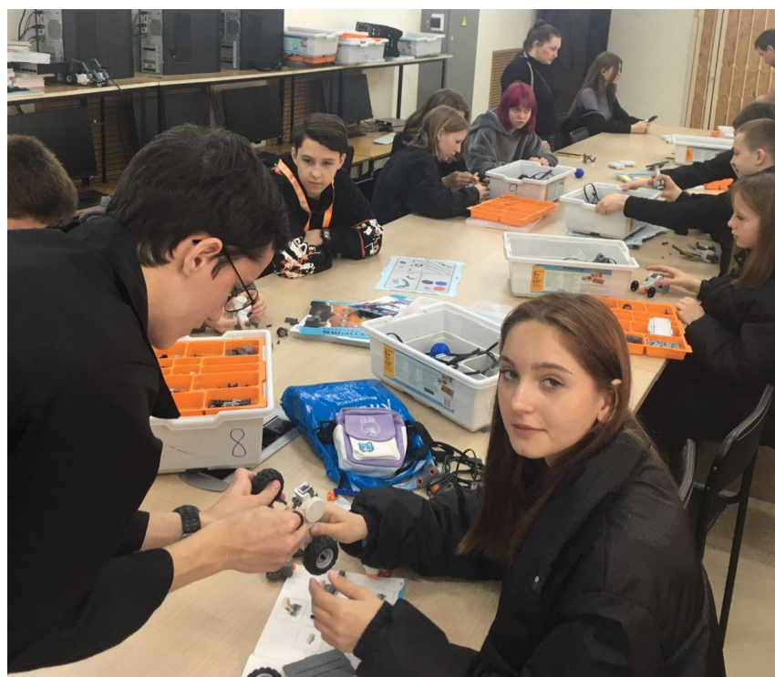
В колледже электронного приборостроения

Мы, педагоги, часто сталкиваемся с тем, что интересы, в том числе и профессиональные, у детей среднего школьного возраста нестабильны, потому выбор профессионального пути и дальнейшего учебного маршрута зачастую оказывается ничем не обоснован. Период реалистического восприятия будущего приходится на старший школьный возраст. Он становится отправной точкой формирования профессиональных интересов, напрямую связанных с видением собственного будущего, места в мире, успеха.